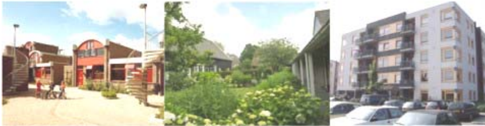
Holanda: Wandelmeent, Vereniging (Popkensburg), Vigo (Veenendaal)

En Holanda las comunidades de mayores se aliaron con las multigeneracionales, de gran tradición en el país, para formar una red de "comunidades con intención" . Cuentan con más de 200 comunidades de mayores en marcha.