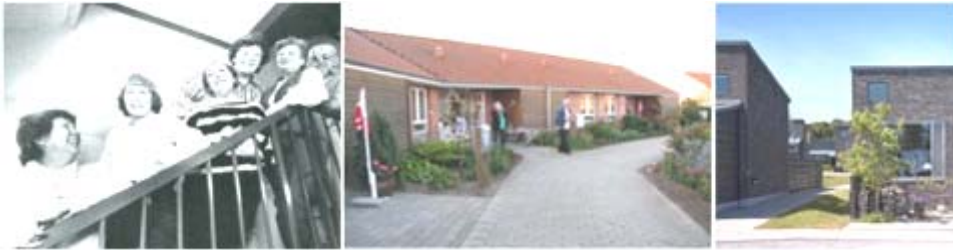
Dinamarca: Midgarden, Lumbylung, Egebakken

En 1987 se conforma el primer Senior-bofællesskab en Dinamarca , llamado Midgården , y formado por 18 apartamentos y zonas comunes. Pronto se percibe la idoneidad de este tipo de organización para comunidades de mayores, y comienza su proliferación. En 1995 se instaura el método Nielsen , con el que sacaron adelante 60 comunidades de mayores en tan sólo 5 años . Hoy en día hay más de 200 en Dinamarca.