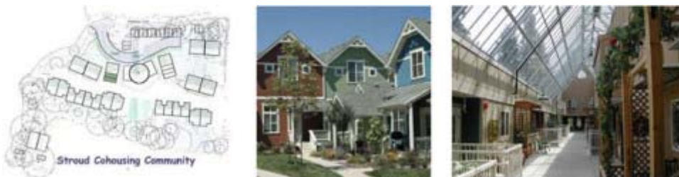
Springhill (Reino Unido), Hearthstone (Colorado, EEUU), Windsong (Candá)

En Reino Unido y Norteamérica este modelo se desarrolla bajo el nombre de Cohousing , con múltiples ejemplos tanto intergeneracionales como de mayores ( Senior-Cohousing ).